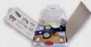
Conjunto completo das peças