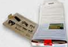
Instrução detalhada para a montagem