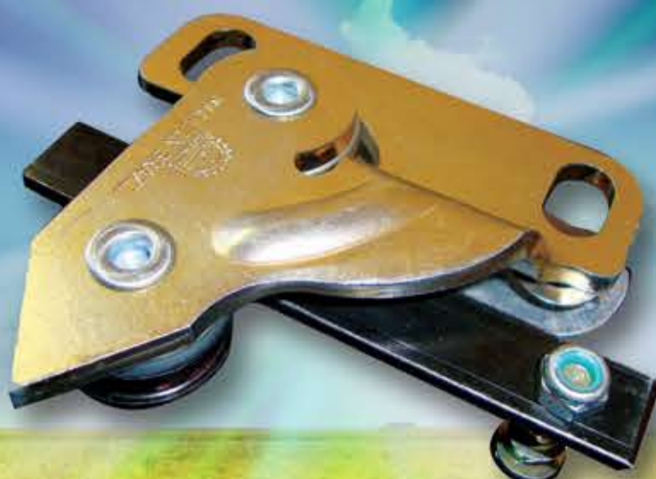
F756040 direcionador da barra de corte John Deere série STS 600

Tecnologia que mantém o corte direcionado e centralizado entre os dedos, sem atrito inferior, superior, dianteiro ou traseiro, mesmo em momento de flutuação da plataforma de corte.